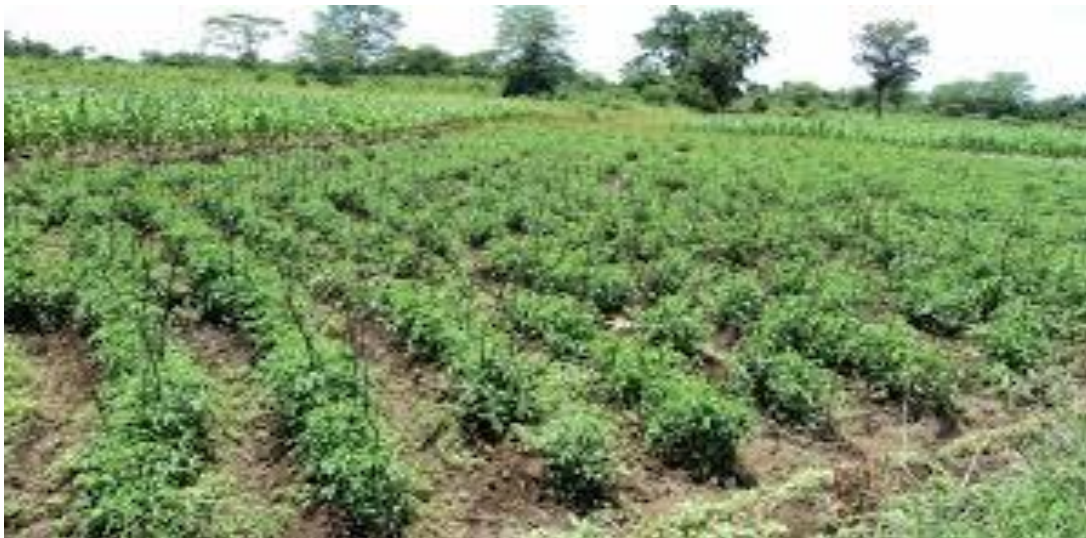
Picha 2: Shamba na Bustani ya mbogamboga, kikundi cha vijana kikohoki, Horohoro