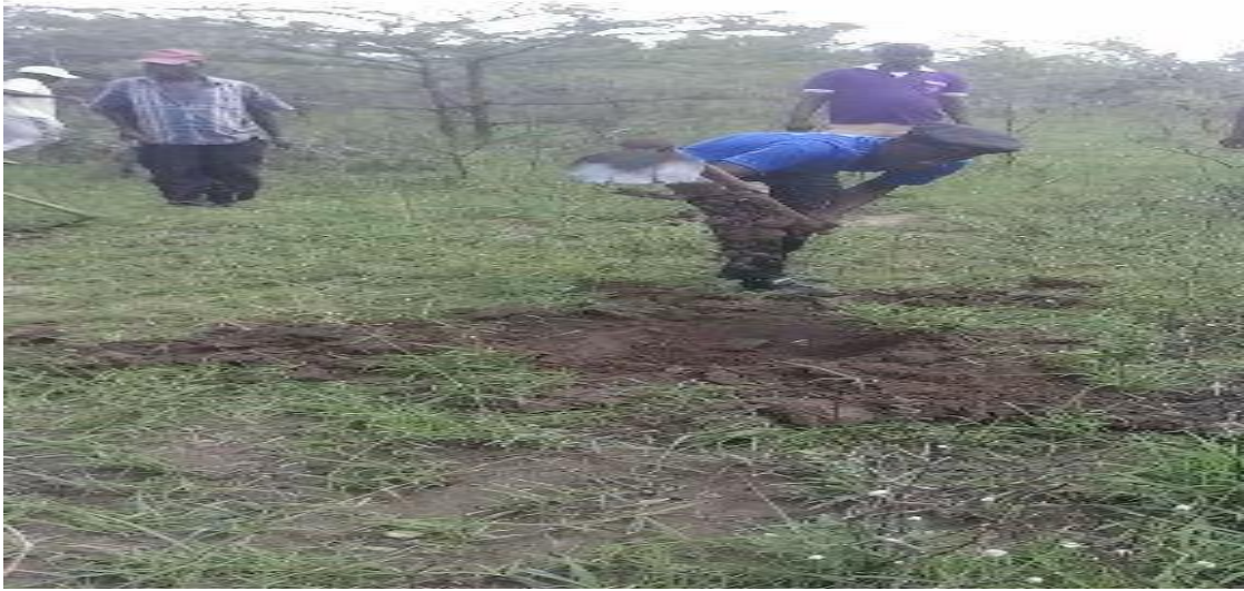
Picha 3: Upandaji miti katika chanzo vya maji, bwawa la parungu kasera.